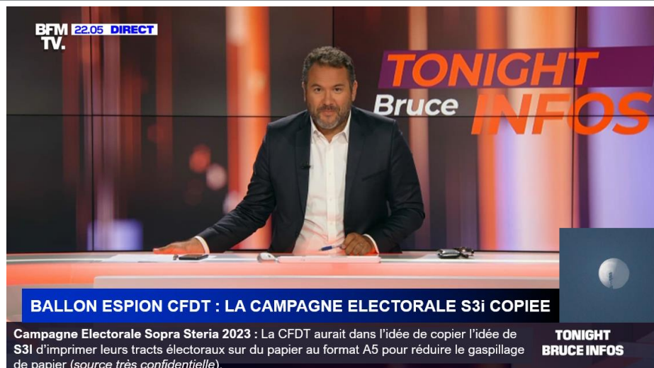
Campagne Electorale Sopra Steria 2023 : La CFDT aurait dans l'idée de copier l'idée de S3i d'imprimer leurs tracts électoraux sur du papier au format A5 pour réduire le gaspillage de papier (source très confidentielle).

Grâce à eux, la Cour de Cassation a « éduqué notre entreprise » en retoquant la décision du tribunal d'appel concernant les primes vacances !!! FAUX - Ce sont plusieurs syndicats (par le biais d'élus au CSE, les élus S3i en étant les moteurs) qui ont porté le sujet en justice !!! Le Comble AVENIR s'est désisté du dossier et n'a pas déposé le pourvoi en Cassation cité, contrairement à S3i !